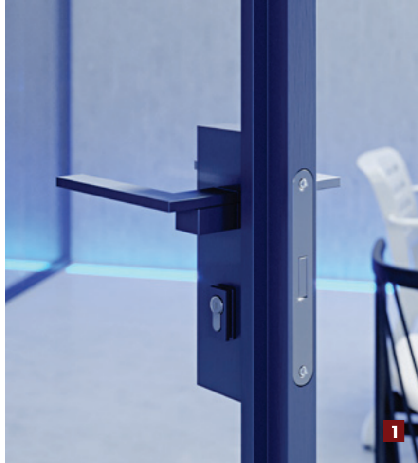
1 Particolare maniglia linea su porta doppio vetro Detail of line handle on double glass door